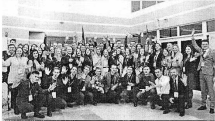
Шосте покоління стипендіатів, 15-01-2020, Київ

Проект фінансується Федеральним міністерством економічного співробітництва і розвитку (BMZ), приймаючими компаніями та впроваджується спільними зусиллями Торгово-промислової палати України та Німецького товариства економічного співробітництва (GIZ GmbH).